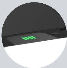
Sterowanie podstawowe – z obudowy