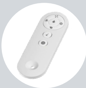
Sterowanie z poziomu pilota