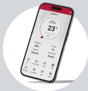
Sterowanie zaawansowane SMART z poziomu aplikacji mobilnej